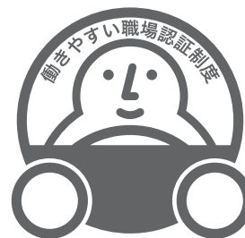
「一つ星」認証マーク

申請受付・認証業務は、国土交通省から、本制度の実施団体に選定された「一般財団法人日本海事協会（通称：ClassNK）」が行います。