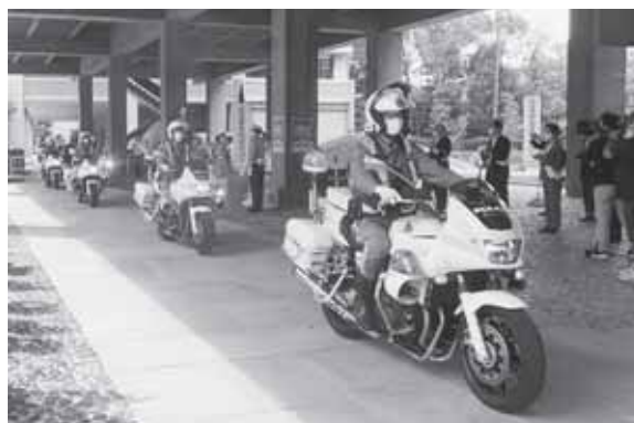
指導取締りに出発