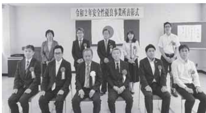
表彰式にて記念撮影