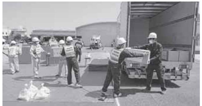
令和2年度総合防災訓練での様子

そうしたなかで、香川県トラック協会では災害発生後の避難所への備蓄物資搬送を想定した訓練を行いました。