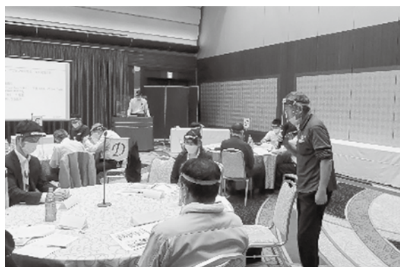
事故防止への取組みを発表