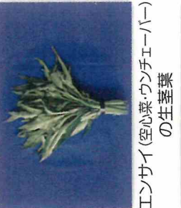
エンサイ(空心菜・ウチエーバー) の生葉