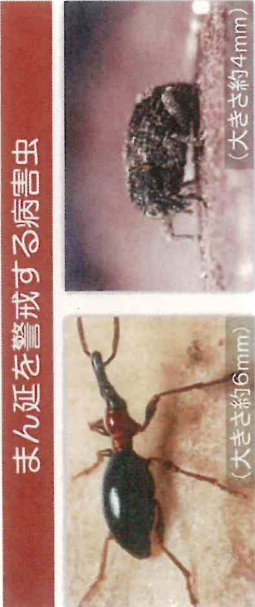
アリモドキゾウムシ (大きさ約6mm)