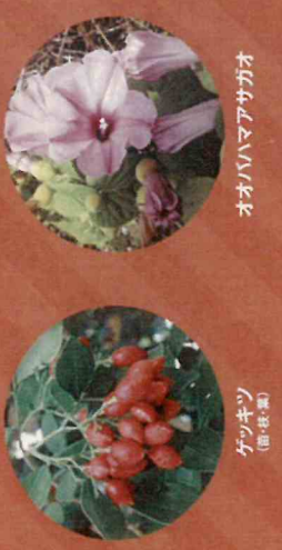
オオハバアマサガオ