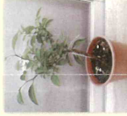
カンキツ類の苗木

■カンキツ類の苗木、穂木、 生茎葉 検査（1年以上必要）を受け、 病害虫の付着が無いことが確 認できれば持ち出せます。