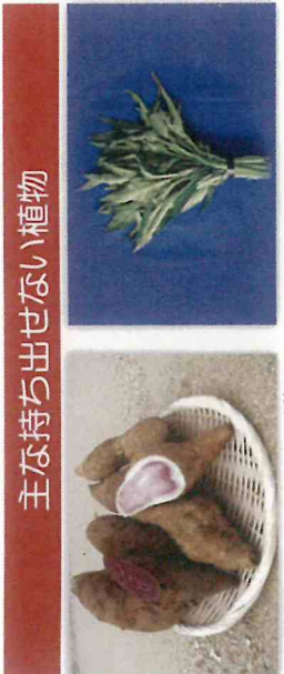
サツマイモ (紅イモなど) の生塊根