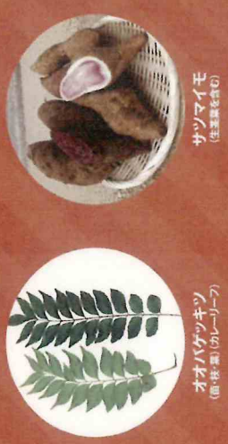
サツマイモ (生芋、煮芋)