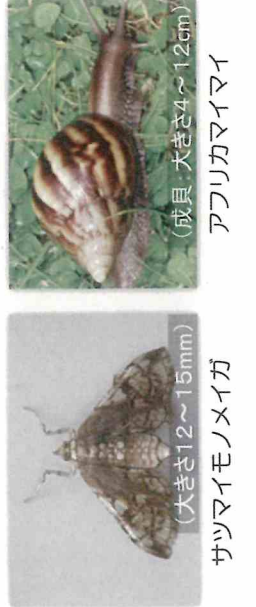
アフリカマイマイ (成貝：大きさ4~12cm)