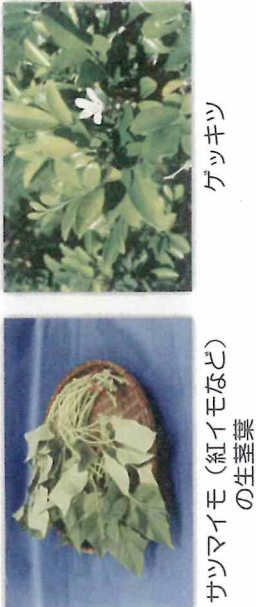
サツマイモ (紅イモなど) の生葉