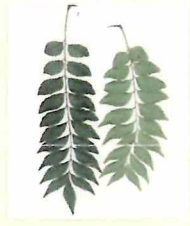
オオバゲッキツ （カレリーフ）の生茎葉

■カンキツ類の苗木、穂木、 生茎葉 検査（1年以上必要）を受け、 病害虫の付着が無いことが確 認できれば持ち出せます。