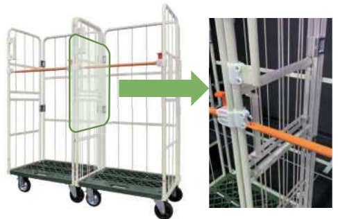
持ち手を本体隙間にスッキリ収納！

専用持ち手は右側面だけにあり、左側面に持ち手の差込口が設けられています。この工夫により、これまで通り2台を並べても隙間なく配置できるようにします。