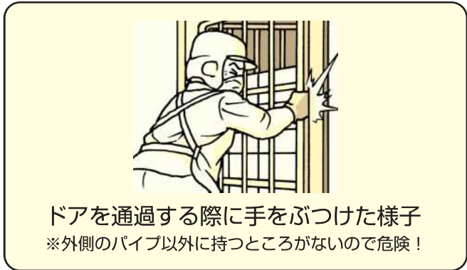
ドアを通過する際に手をぶつけた様子 ※外側のパイプ以外に持つところがないので危険！

●手押し台車のような持ち手がないため、四隅のパイプが持ち手になります。●そのため、ドアなどの狭い通路で手が壁にぶついたり、はさまったりしてケガをするおそれがあります。●大きいサイズのロールボックスパレットでは、左右のパイプとパイプの間が長くなるので、両手を肩幅よりも広げて持つことになり、力が入れにくくなります。