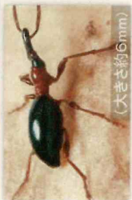
アリモドクソウムシ (大きさ約6mm)