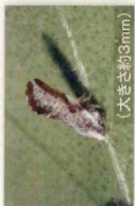
ミカンキジラミ (大きさ約3mm)