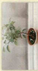
カンキツ類の苗木

蒸熱処理(数日必要)を行えば持ち出せます。 なお、サツマイモの加工品は、自由に持ち出すことができます。 詳しくは、事前に裏面★印の植物防疫所にお問い合わせてください。なお、現在小笠原諸島には蒸熱処理施設がありません。