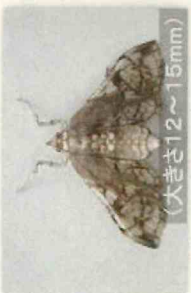
サツマイモノメイガ (大きさ12~15mm)