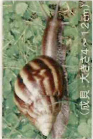
アフリカマイマイ (成貝、大きさ4~12cm)