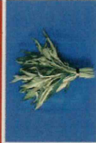
エンサイ(空心菜・ウチナーエーバー) の生茎葉