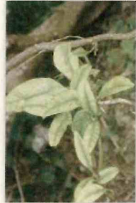
カンキツグリーニング病菌 (病気の症状)