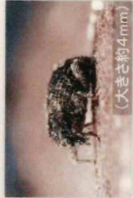
イモゾウムシ (大きさ約4mm)