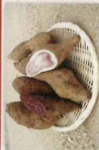
サツマイモ(紅イモなど) の生塊根