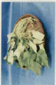
サツマイモ(紅イモなど) の生茎葉