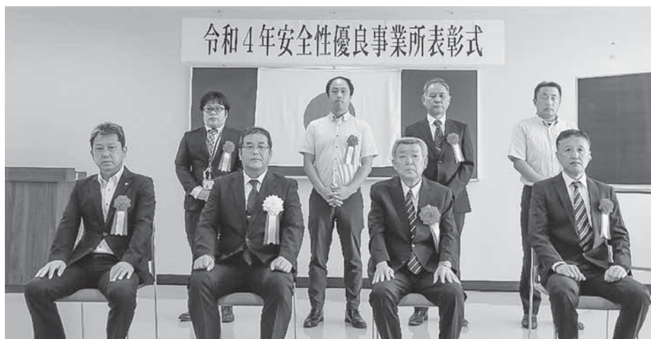
表彰式にて記念撮影