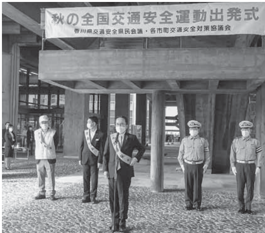
香川県交通安全県民会議会長(池田豊人 香川県知事)