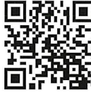
中村河川国道事務所