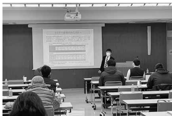
遠藤安全管理士による講義