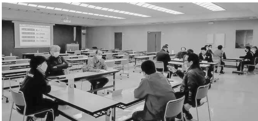
グループ内討議にて事故防止に向けて語り合う受講者

当日は、SOMPOリスクマネジメント株式会社より講師を招き、事業用トラックによる事故の傾向と防止対策について座学のほか、グループディスカッションを通して受講者同士で情報交換を行いました。