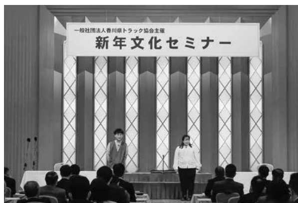
駆け抜けて軽トラ