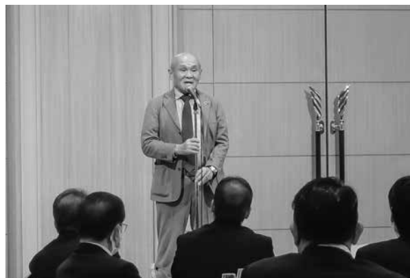
交流会で挨拶をする楠木会長