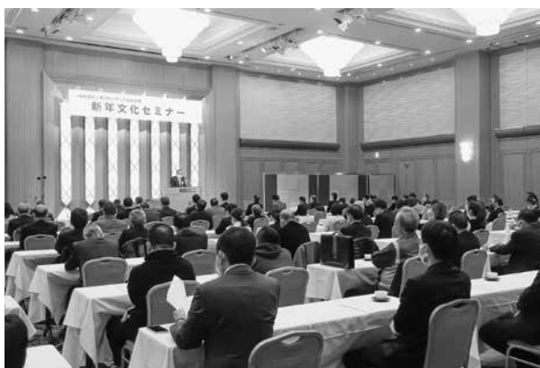
新年文化セミナー