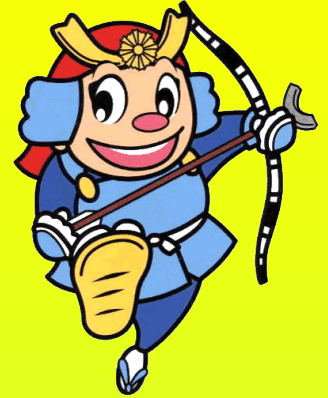
香川県警察シンボルマスコット 「ヨイチ」

令和5年5月19日～21日に広島 県で開催される、「G7広島サミット」 に伴う関係閣僚会合として、 「G7香川・高松都市大臣会合」 が開催されます。