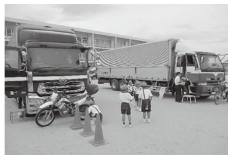
さぬき市立志度小学校(6/29)