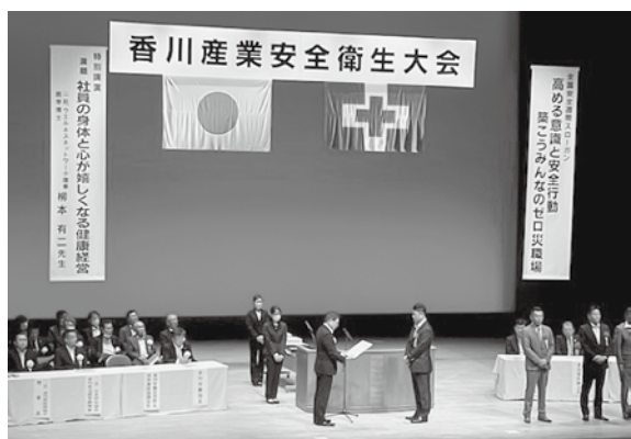
【香川労働災害防止団体連絡協議会長賞】優良賞を受賞