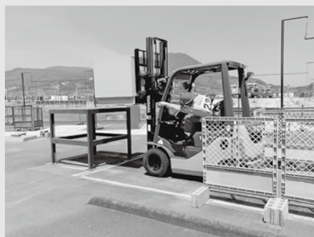
点検・運転競技の様子