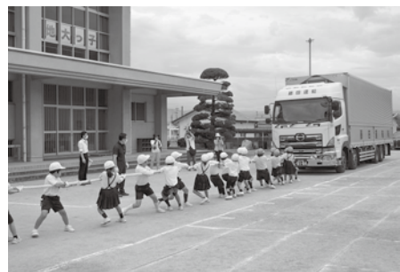
三豊市立比地大小学校(5/29)

参加した児童からは「本物のトラックは大きくてびっくりした。」「死角実験では、トラックの周りは運転手さんから見えない所がいっぱいで、危険なので近寄らないようにしようと思った。」などの反響が寄せられ、効果的な体験学習となりました。