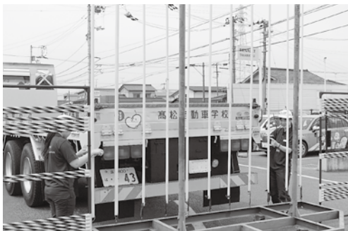
運転競技(ホーム着け)