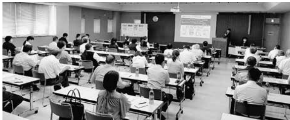
定期健康診断結果のフォローアップの重要性を説明する講師

このほか、高齢ドライバーへの健康と安全対策のポイントや、睡眠時無呼吸症候群（SAS）対策の基本的な知識についても話され、講師は出席者に対し、健康管理対策の重要性を強く伝えられていました。