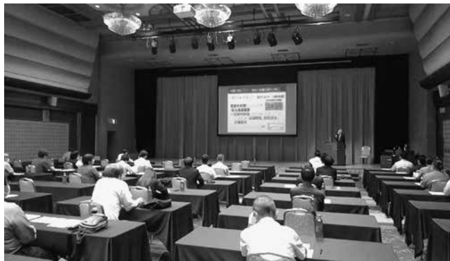
熱心に耳を傾ける参加者