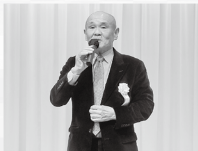
賀詞交歓会で挨拶する楠木会長