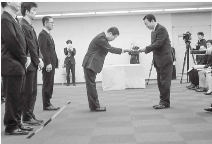
大西会長に目録を手渡す