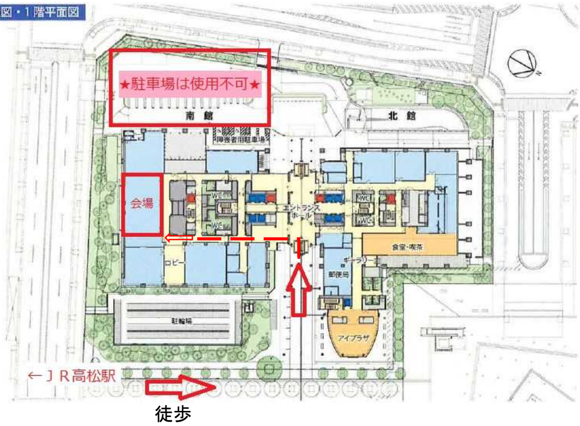
配置図・1階平面図