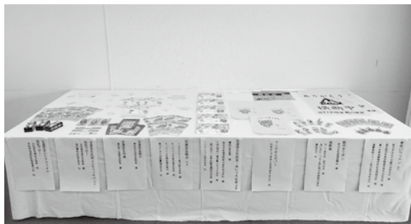
展示された交通安全用品