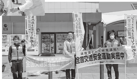
4/11 津田の松原SA(香ト協青年協議会・女性部会)