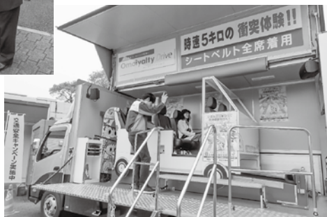
4/10 豊浜SA(高速交協、NEXCO、香川県警等)