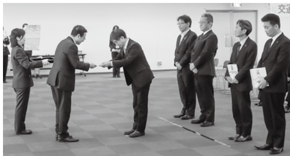
大西会長に目録を贈呈