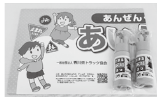
贈呈した 交通安全あいうえお帳と色鉛筆

この寄贈事業には、香ト協のほか、金融機関や生命保険会社、交通安全協会などが協賛し、様々な交通安全用品を高松市内の小学校、幼稚園、保育所などに無料配布しています。